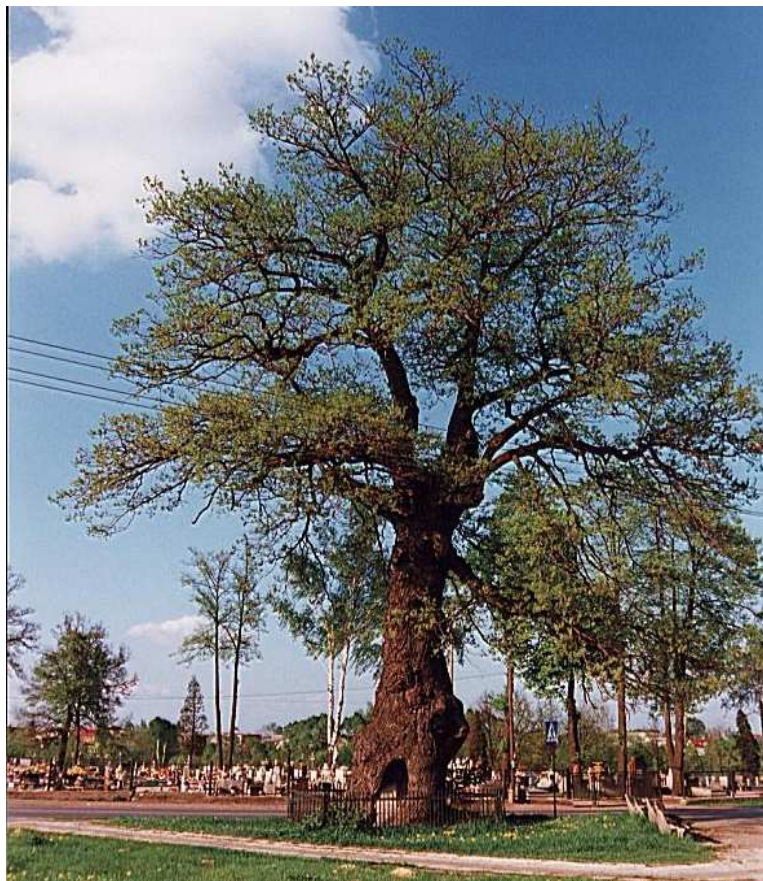
Rysunek 3. Pomnik przyrody – dąb „Bartek” przy drodze krajowej nr 78.

Powiatowy program ochrony środowiska wskazuje konieczność sporządzenia inwentaryzacji i waloryzacji zasobów przyrodniczych gminy dla pełnej oceny istniejących zasobów przyrodniczych oraz przygotowania planów ich ochrony. Koszt przygotowania inwentaryzacji i waloryzacji zasobów przyrodniczych wyniesie około 10 tys. zł.