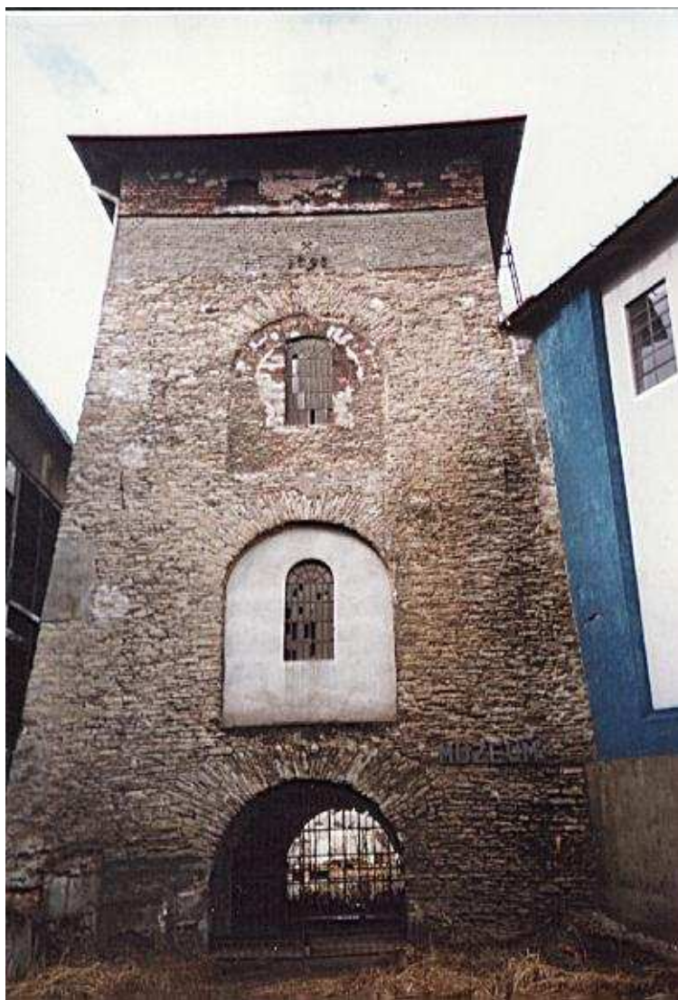
Rysunek 4. Budynek „Wieży wyciągowej” z 1798 roku w Fabryce Urządzeń Mechanicznych.