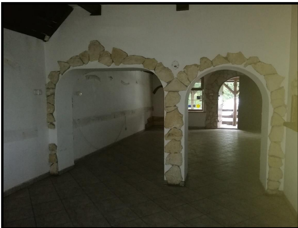
Fot. nr 4