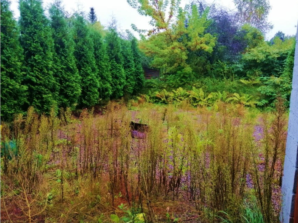
Fot. nr 7