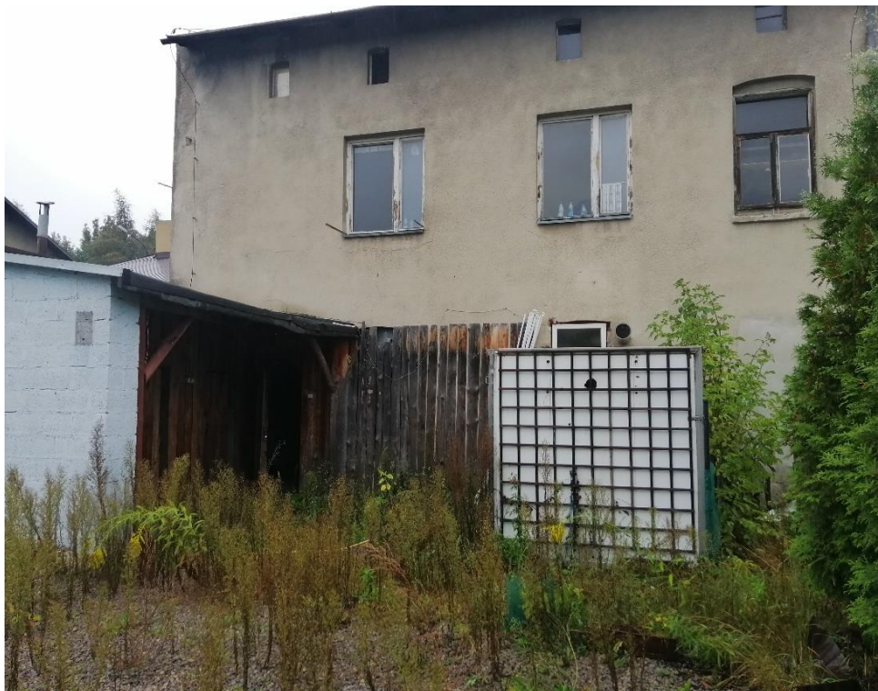
Fot. nr 6