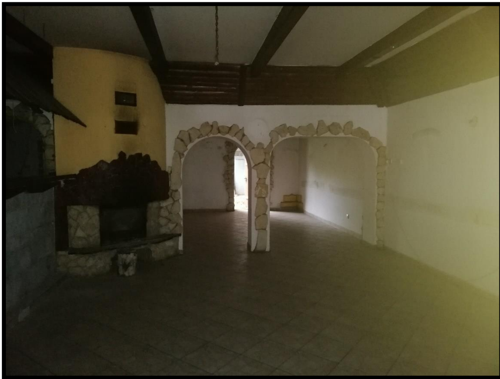
Fot. nr 3