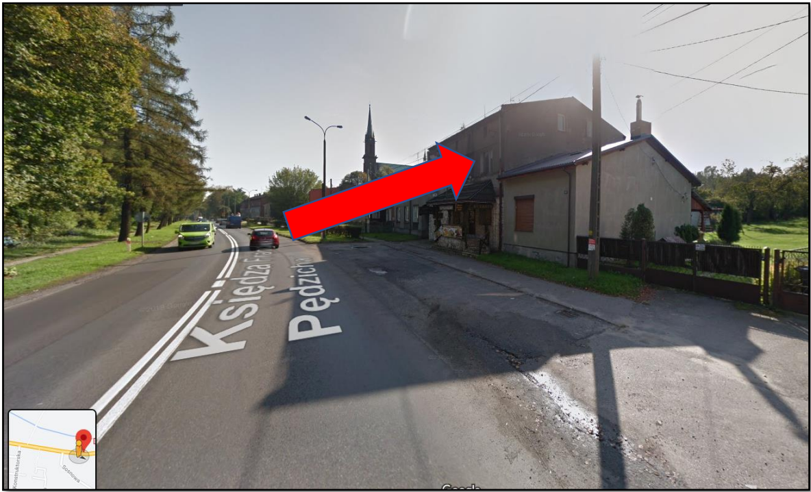
Fot. nr 1