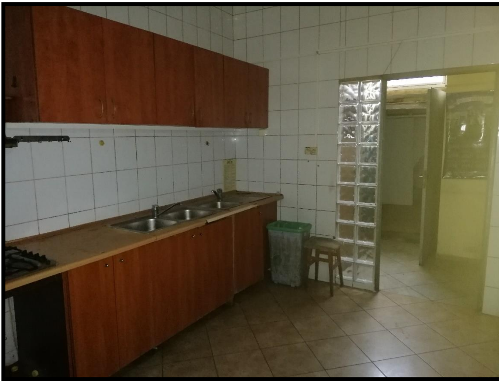
Fot. nr 5