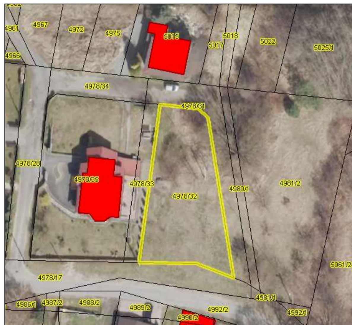
Działka nr 4978/32